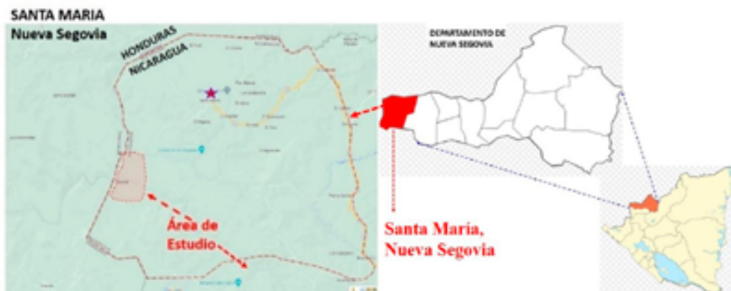
Imagen 1. Localización del área de estudio. Municipio de Santa María, Nueva Segovia.

El Municipio de Santa María, se encuentra ubicado en el extremo oeste del Departamento de Nueva Segovia, a 185 km de distancia de la ciudad capital. Posee una extensión territorial de 168 km 2 , presentando sus límites norte y oeste con la República de Honduras, por el sur con el Municipio de Somoto (Dpto. de Madriz) y por el este con Municipio de Macuelizo.