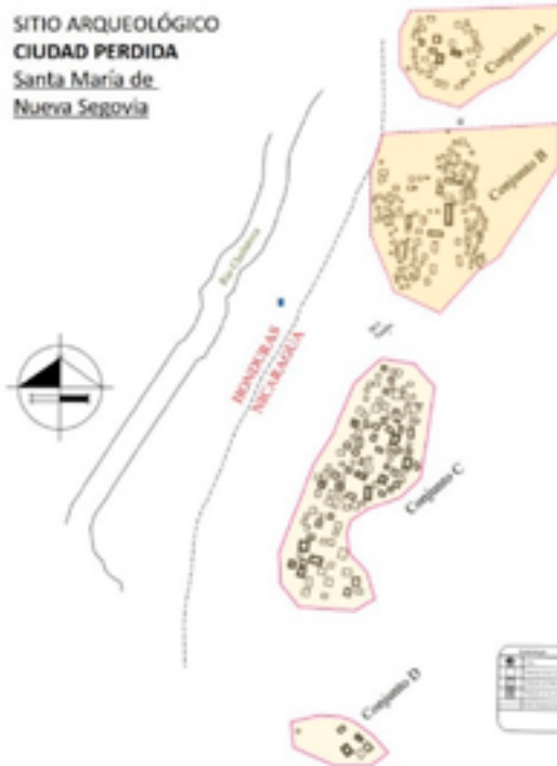
Imagen 4. Sitio arqueológico Ciudad Perdida. Distribución espacial de estructuras.

La tipología cerámica sugiere que las principales ocupaciones de este sitio se dieron entre el 300-800 d. C. un periodo de mucha interacción social entre los pueblos que habitaban el territorio nicaragüense y hondureño. La mayoría de los artefactos de procedencia hondureña corresponden a bienes de prestigio que formaron parte de interacción, relación o alianzas entre posibles élites políticas y económicas en esas antiguas poblaciones. De hecho, hoy en día se mantiene esa fluidez de productos y relaciones entre comunidades del Norte de Nicaragua y Honduras.