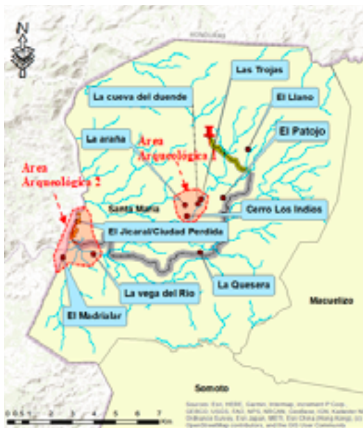
Imagen 2. Sitios arqueológicos documentados en el municipio de Santa María, Nueva Segovia. En color rojo, las áreas arqueológicas definidas.

Se definieron dos áreas arqueológicas en base a la proximidad de sitios, características y similitud tipológica. La primera de ellas se localiza al sur de la cabecera municipal y la conforman los sitios, Las Trojas, Cueva de El Duende, cerro Los Indios y La Araña, la particularidad de esta zona es la presencia y variabilidad de sitios, uno con petroglifos, otro con pictografías, estructuras y materialidad en superficie. Se pueden inferir ocupaciones antiguas e interrelaciones entre los antiguos pobladores de estos sitios, debido a la variedad y riqueza de recursos que existen y seguramente existieron en la zona: recursos geológicos (rocas y suelos aptos para agricultura), hídricos, flora y fauna.