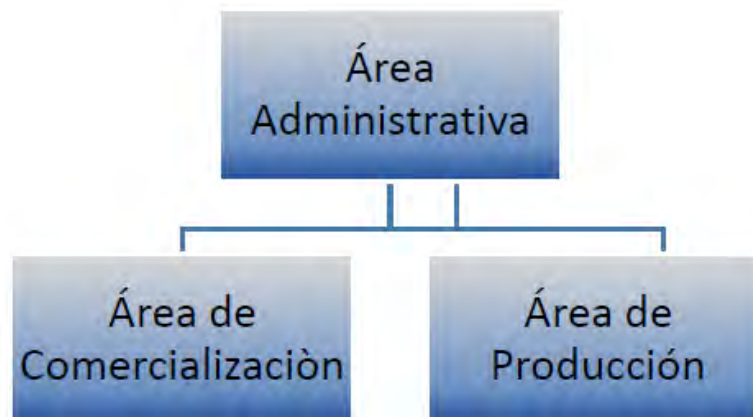
Grafica N°1 Organigrama de la Empresa Familiar Moda Rosibel

Diciembre, 2019