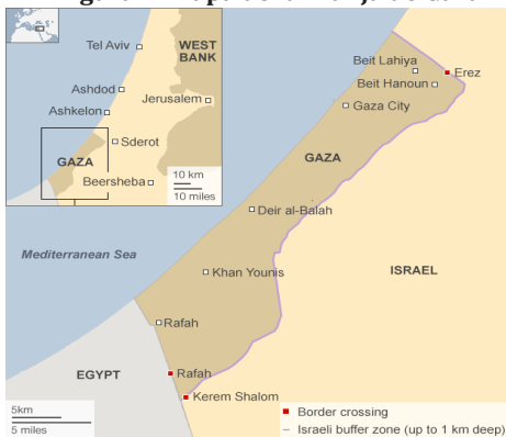
Figura 1: Mapa de la Franja de Gaza

Cabe destacar que la Franja de Gaza está catalogada como una de las regiones más densamente pobladas del planeta con 4,118 personas por km 2 . Posee una superficie de 360 kilómetros cuadrados 1 donde habitan, según estimaciones, casi dos millones de palestinos.