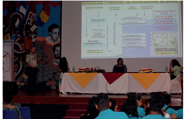
Fotografía 4 Teniente Coronel Francisco Moncada, Ejército de Nicaragua

Por su parte el Teniente coronel Francisco Moncada (Fotografía 4) disertó acerca del Uso de tecnologías para la elaboración de mapas topográficos. En ella explicó los métodos y procedimientos para la elaboración de mapas en el Ejército de Nicaragua. De igual manera, explicó la metodología y el proceso de digitalización de mapas.