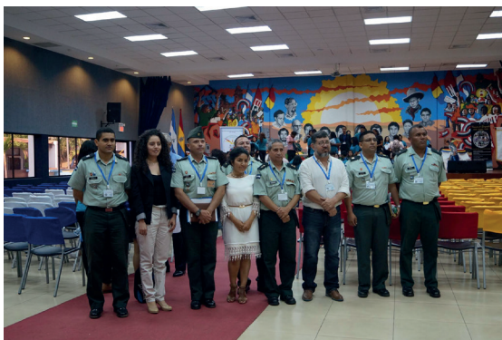
Fotografía 13 Invitados del Ejército de Nicaragua y docentes del Departamento de Geografía