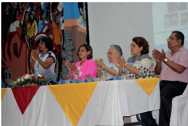
Fotografía 1. Inauguración del ISNG, 2017.

Entre los participantes al simposio, debe de destacarse en primer lugar a los docentes del Departamento de Geografía y Antropología, y estudiantes de ambas carreras. En calidad de invitados, participaron delegados del Ejército de Nicaragua, Instituto Nicaragüense de Tecnología Agropecuaria (INTA), Universidad Nacional de Ingenierías (UNI) y Centro Humbolt. Dos fueron los ejes temáticos sobre los cuales giraron las disertaciones y discusiones: a) Recursos Naturales, dinámica y aprovechamiento; b) Urbanismo, Educación, Población y Ambiente.