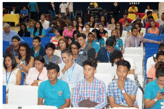
Fotografía 14 Invitados y participantes del ISGN