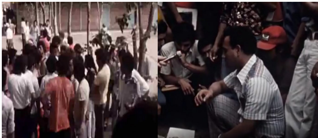
Ilustración 2. Comunidad universitaria en el RURD y testimonio de entrevistado #2 informa sobre el suceso y explica sobre los restos óseos esparcidos de los estudiantes asesinados.

Ese actuar corresponde justamente al pánico sembrado desde sus inicios al punto que las clases desposeídas por ejemplo el campesinado las vivió con creces con finales trágicos como la muerte sin piedad de modo que sus acciones quedaron en la “impunidad” .