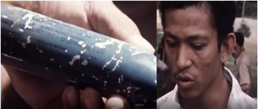
Ilustración 1. Modelo de bomba lanzado y testimonio de entrevistado #1, explicando que es lo que sucedió ese día en el RURD.

“ Los miembros de la comunidad universitaria últimamente hemos recibido variados ataques de parte de la Guardia Nacional que como todos saben está al mando del general Somoza, Anastasio Somoza Debayle hijo de Anastasio Somoza García, hermano de Luis Somoza, ehh, personas que han dominado el país desde hace 44 años, el sábado pasado [en fecha calendárica correspondería al 22 de febrero de 1978], sufrimos una agresión de parte de la Guardia Nacional cuando elementos del somocismo pasaron provocándonos aquí, en nuestros predios lanzando consignas a Somoza “viva Somoza” y lanzando balazos al aire y entonces la reacción de nosotros no se hizo esperar y firmemente estuvimos aquí repudiando su actitud entonces se hicieron varias patrullas de la Guardia y nos agredieron a balazos y bombas lacrimógenas de las más modernas que parece que le han enviado los EE.UU, porque tienen fecha de 1978 (ilustración 1), el día de ayer, que día fue, el día de ayer lunes 27 de febrero fuimos atacados de una forma más brutal todavía que como o habían hecho anteriormente ya que no se limitaron a disparar al aire como lo habían hecho anteriormente pues, siempre nos han lanzado las bombas lacrimógenas directamente pero ayer nos lanzaron a parte de las bombas lacrimógenas balazos a matar” (s/n, estudiante #1 y testigo ocular en entrevista brindada a rtve.es, 28 febrero de 1978).