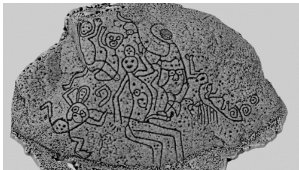
La Dama de las Tinajas. Símbolo icónico del municipio de Diriá 2020.

El proyecto de Diriá cuenta con un inventario de sitios arqueológicos y con una propuesta de ruta turística. De igual manera, con una propuesta de museo de sitio El Boquete, que incluye un recorrido por la ladera de la laguna y la visita a los petroglifos, destacando La Dama de Las Tinajas y su entorno natural. Este espacio, por su fácil acceso, reúne condiciones para su puesta en valor, ya que existen pequeños senderos preestablecidos que pueden acondicionarse con un mínimo de inversión.