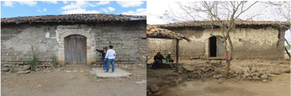
Monumentos históricos La Casona. El Zapotal- Las Brisas. Santa María. Nueva Segovia Fuente propia

En el caso del municipio de Santa María de Nueva Segovia, cuenta con planes municipales para la puesta en valor de La Cueva del Duende y la restauración del monumento histórico, La Casona, en la localidad El Zapotal-Las Brisas. Estas acciones forman parte del esfuerzo estratégico realizado por los gobiernos locales, las comunidades y la Universidad para el fortalecimiento de la identidad individual y colectiva en estos espacios socioculturales.