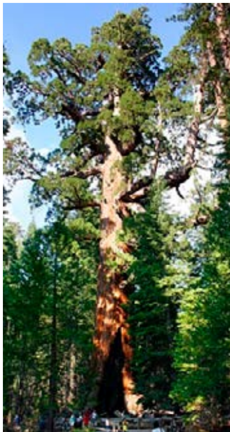
Ceiba, árbol sagrado. Foto: Oscar Chacón, 2020).

Los sitios sagrados constituyen un pilar esencial en la cosmovisión indígena miskitu y sumu/mayangna, determinando el uso del bosque. Generalmente se encuentran ubicado en lugares especiales o escogidos para desarrollar rituales en ocasiones especiales.