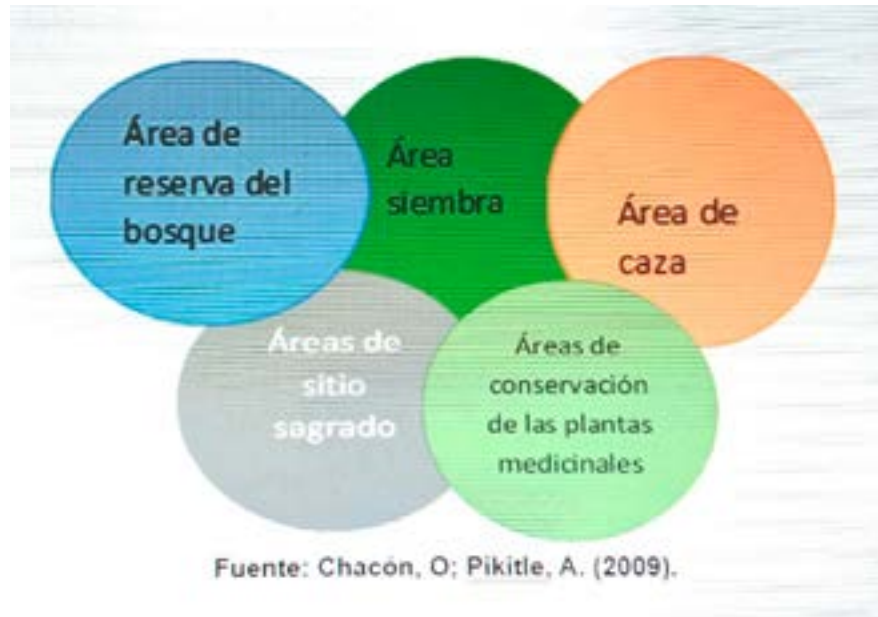
Grafica 2: Dinámica de uso del bosque desde la perspectiva miskitus y sumu/mayangnas de la RACCN.

De acuerdo al Compendio del marco jurídico legal (s.f.), los derechos de propiedad sobre las tierras son comunales o comunitarias; los miembros de una comunidad o de un conjunto de estas tienen derecho de ocupación y usufructo, de acuerdo a las formas tradicionales de tenencia de la propiedad comunal. El uso de los bosques se distribuye en cinco áreas, correspondiendo a las tradiciones culturales de los pobladores de estas comunidades. Según Larson, A. (2009), «esta práctica incluía no solo el uso de recursos especialmente madera para su uso doméstico, sino también para su comercialización, lo que significa una regla más compleja de cumplir en las comunidades».