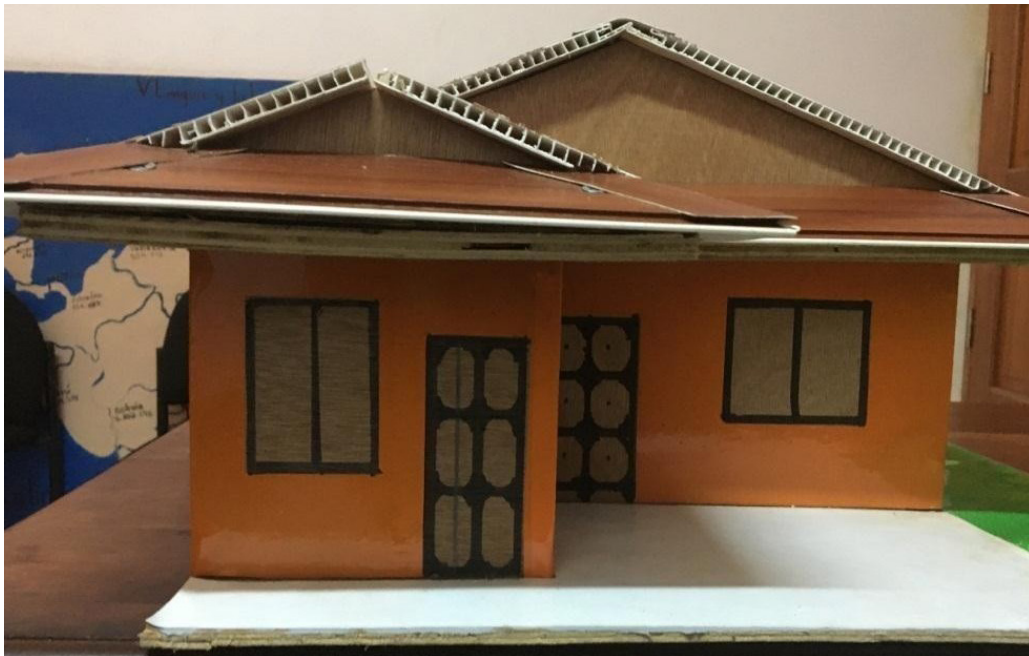
Autores: Estudiantes de Construcción Técnico Medio BICU Bilwi.