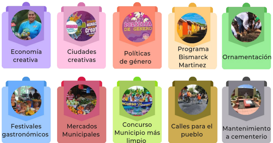
Figura 1. Programas y proyectos de gestión pública

No puede haber un desarrollo comunitario, si no se gestionan todos sus componentes. En este sentido, la gestión que propician los gobiernos locales está en función de la articulación Gobierno-Sociedad. En la siguiente tabla se muestran los diferentes programas que se han desarrollado a partir del enfoque de Gestión pública en las diversas Municipalidades.