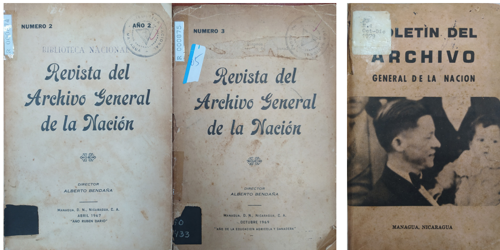
Figura 5. Esta última es la primera publicación de dicha institución con una imagen impresa, la misma denota un cambio en el discurso nacional al presentar al General Augusto C. Sandino.