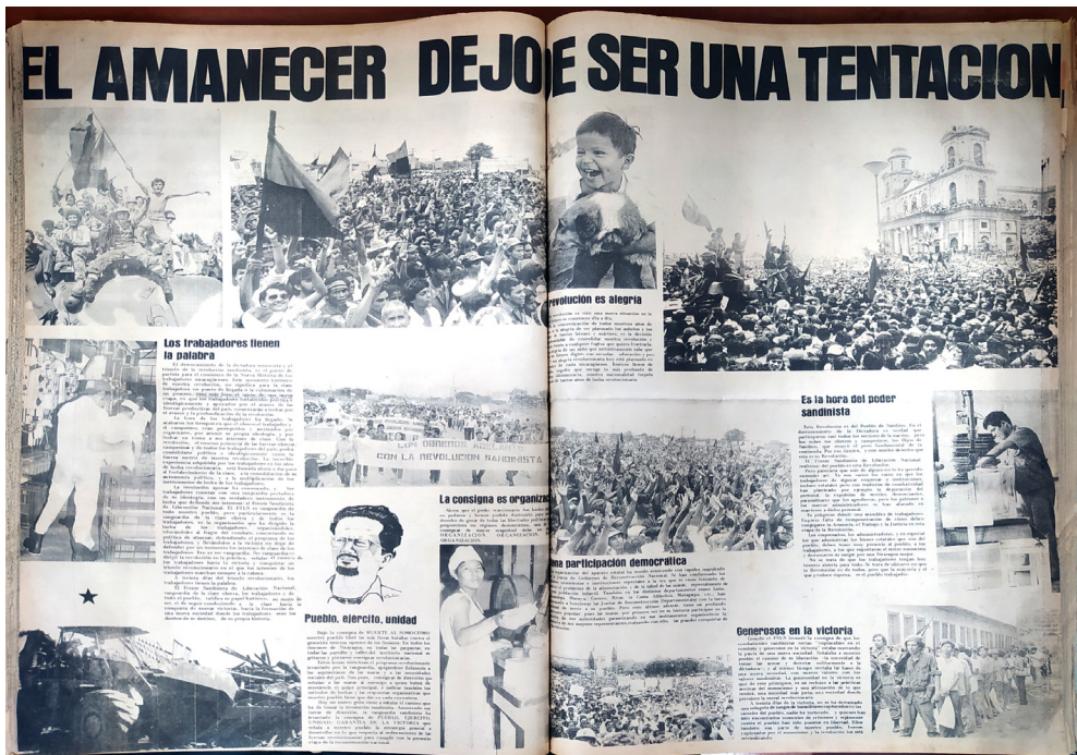
Figura 6. Fotografías en conmemoración a la Insurrección Popular publicadas en el Diario Barricada; al día de hoy los números correspondientes de julio y agosto de los periódicos nacionales son considerados patrimonio nacional, por su labor al evidenciar el proceso histórico.