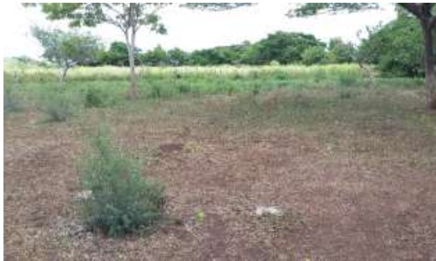
Figura 4. Suelo desprovisto de cobertura vegetal.