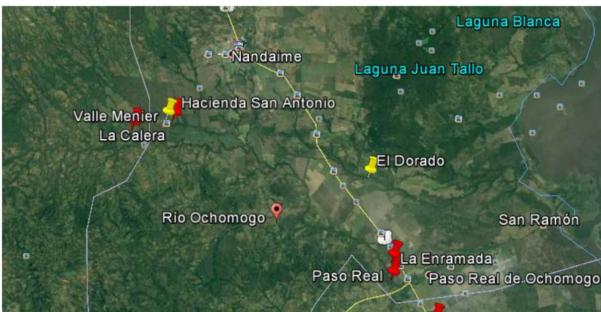
Figura 1. Ubicación de los sitios de muestreo de referencia (amarillo) y de estudio (rojo) para análisis de ^{137}\text{Cs} en suelos de la subcuenca del Río Ochomogo, junio y agosto, 2015.

25 lb y fueron transportadas cuidadosamente para ser analizadas de acuerdo al Procedimiento Operativo Normalizado (PON) del análisis de ^{137}\text{Cs} en suelos y sedimento del Laboratorio de Radioquímica Ambiental del CIRA/UNAN-Managua. Este procedimiento sigue las recomendaciones emanadas del Proyecto Regional Latinoamericano RLA 5/051 (ARCAL C): Uso de radionúclidos ambientales como indicadores de degradación de suelos en ecosistemas de Latino América, El Caribe y el Antártico (IAEA, 2008).