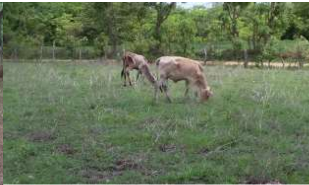
Figura 5. Suelo utilizado para pasto de ganado.