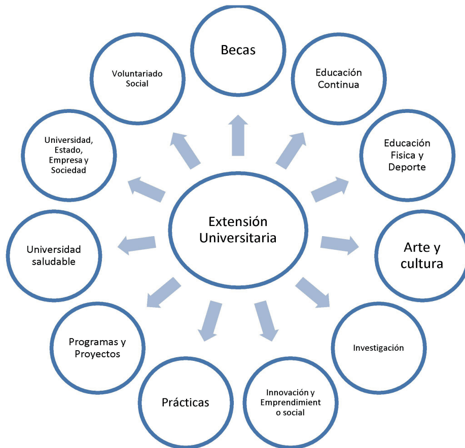
Figura 1 Áreas de la Extensión y Proyección Universitaria.

Estos elementos son coincidentes con lo expresado por (Tommasino & Rodríguez, 2010): “En general a la extensión se la visualizó como una función aparte, ajena a la vida universitaria cotidiana que fundamentalmente transcurre en las aulas y los laboratorios. Salvo excepciones, no estaba comprendida en la curricula, era más bien una actividad llevada adelante en el tiempo libre, colocada en un lugar donde no interfería con las actividades curriculares obligatorias” (2010, p. 22).