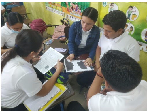
ILUSTRACIÓN 6 Aprendiendo Filosofía aplicando la lógica

La última sesión didáctica se desarrolló el día 27 de septiembre, en horario de 7:45 a 8:30 am, iniciando con un breve saludo, invocando una oración al Creador, seguidamente del diálogo entre estudiantes y docente sobre los diferentes temas que se abordaron durante la visita, luego se les orientó que para finalizar, realizaríamos una prueba final, similar con la del primer día de intervención, se les dio todas las recomendaciones, cada estudiante recibió su prueba, el docente lee la prueba y los estudiantes con actitud y excelente disciplina dieron inicio a contestar, luego cada estudiante poco a poco fue entregando, al final se les brindó las gracias por la disposición y entrega de su participación durante todas las visitas, los estudiantes también expresaron su sentir, expresando que se sentían privilegiados con las clases que la docente impartió porque sólo fue con ellos y que nos recordaran por compartir en especial con ellos.