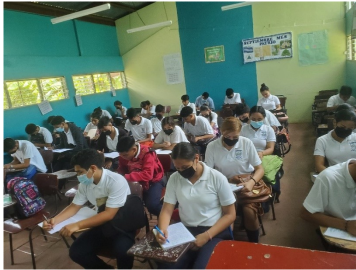
ILUSTRACIÓN 1 Resolución de prueba diagnóstica