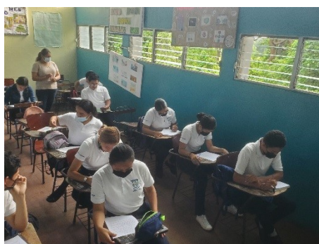
ILUSTRACIÓN 5 Resolución de prueba final

Para la comprensión del mismo se hizo una competencia de resolver un primer acertijo y estimular su mente para que activaran su razonamiento, su agilidad mental y así dar solución a los casos preparados. Leen y se discuten los principios del tercer excluido y de la razón Suficiente y se procede a darles los casos a resolver, resuelven a manera de conclusión comparten solución de casos y la relación con los principios.