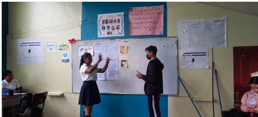
ILUSTRACIÓN 3 Aplicación de la estrategia "El mimo"

del indicador de logro a alcanzar, en donde los estudiantes socializan y comparten con actitud crítica sus propios puntos de vista en relación a lo que plantea el docente, dando continuidad al proceso a cada grupo se le entregó una carta en donde se dio a conocer un mensaje codificado y brindó la explicación a cada grupo, que a través de la estrategia el mimo como recurso de expresión corporal para la codificación y descodificación de mensajes que presentarían ante sus compañeros quienes lo descodificarían. Al momento de presentarse ante sus compañeros se realizó una rifa de colores y el color que salía era el grupo que se presentaba, así sucesivamente hasta que todos participaron, finaliza la docente argumentando la importancia de la comunicación y el asertividad en la descodificación y su valoración de la clase recibida, en donde los estudiantes dieron comentarios optimistas y significativos de lo realizado durante la intervención.