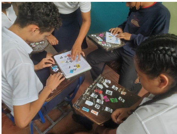
ILUSTRACIÓN 4 Resolviendo actividades a través del juego