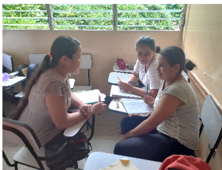
FIGURA 3. Estudiantes socializando sus saberes

Dicho esto, es notorio que las metodologías participativas a través de la puesta en práctica de técnicas grupales favorecen enormemente el aprendizaje, entre ellas por las siguientes razones: (1) el estudiante centra su atención en la resolución de una actividad, (2) el estudiante es tomado en cuenta dentro de un colectivo, (3) se socializan ideas, (4) se desarrollan pequeñas discusiones grupales que implican el planteamiento de argumentos, contrargumentos, realización de consenso y discrepancias, (5) se construye colectivamente el saber. A continuación, se describen algunas de las actividades desarrolladas en la asignatura Didáctica de las Ciencias Sociales: