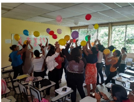
FIGURA 1. Estudiantes participando en dinámica de integración

Sugerimos comenzar y finalizar las sesiones con un “epílogo/ prólogo sorpresa”, es decir, con algún recurso (problema irresoluble, poesía, frase impactante, cuento, fotografías, frase cortada, etc.) que sirva para captar la atención del alumno desde un primer momento o para intrigarlo o estimularlo para la próxima sesión (p.130).