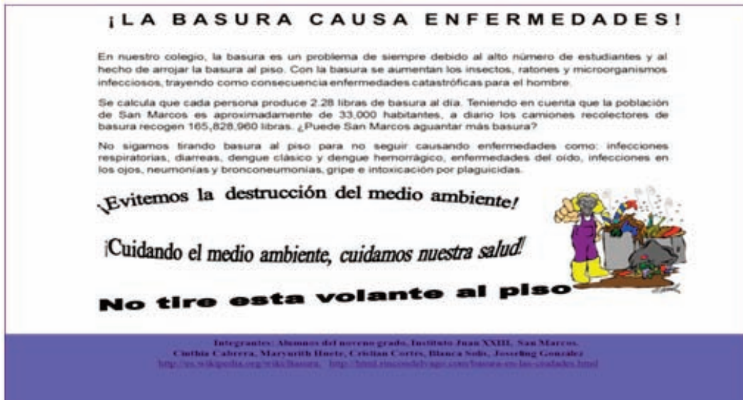
Ejemplo de borrador y flyer (trabajo final) creado por un grupo de estudiantes de noveno grado