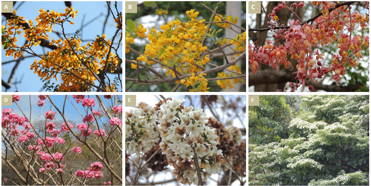
Imagen 4. Algunos árboles de floración intensa importantes para el ornato. A: Sangredrigo del pacífico ( Pterocarpus rohrii ). B: Vainillo ( Senna atomaria ). C: Carao ( Cassia grandis ). D: Macuelizo, Falso roble ( Tabebuia rosea ). E: Laurel macho ( Cordia gerascanthus ). F: Madroño ( Calycophyllum candidissimum ).