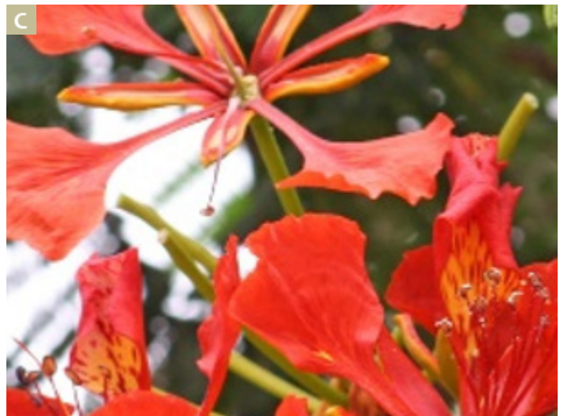
Imagen 2. A: neem ( Azadirachta indica ). B: laurel de la india ( Ficus microcarpa ). C: malinche ( Delonix regia ).