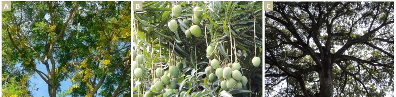
Imagen 3. A: Guachipilin ( Diphysa americana ). B: Mango ( Manguijera indica ). C: Ceiba ( Ceiba pentandra ). Fuente: Elaboración propia según los datos recopilados.

Fuente: Elaboración propia según los datos recopilados.