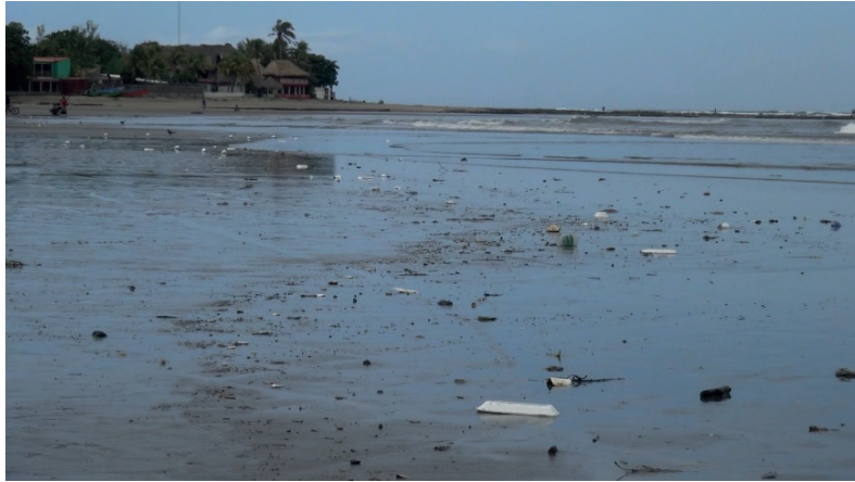
Figura 2. Fotografía de la costa de playa Masachapa