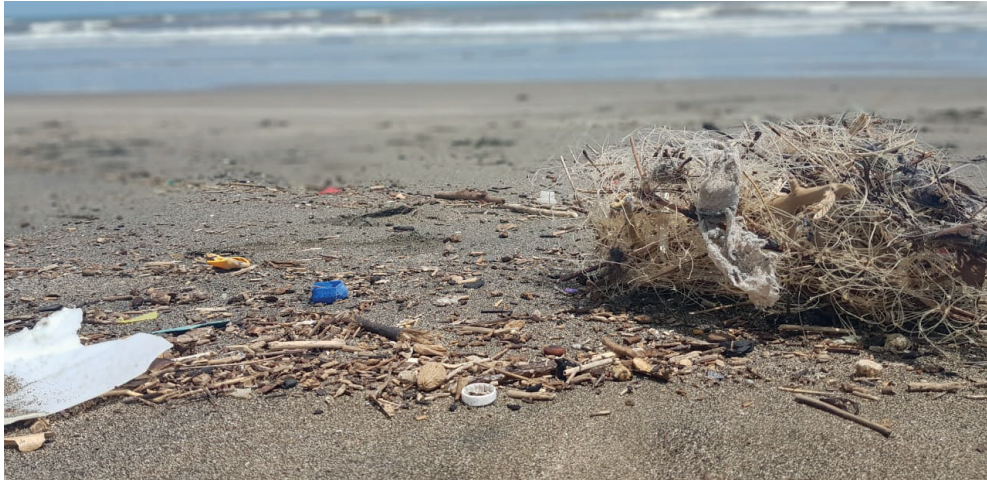
Figura 3. Imagen de red fantasma encontrada en playa la boquita

La ingesta de microplásticos es otro problema importante que afecta la fauna acuática, las especies como los cetáceos, aves marinas, entre otros confunden las piezas plásticas con su alimento natural, produciéndose así principalmente bloqueo del tracto digestivo y falsa saciedad (Moore, 2008)