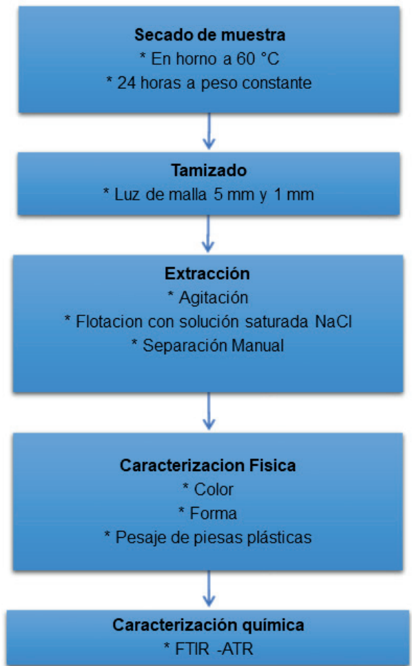
Figura 4. Diagrama del proceso analítico para determinar microplásticos en arena de playa

Extracción de los microplásticos: la fracción de arena retenida por el tamiz de 1mm es donde quedan retenido los microplásticos. Para separar los microplásticos de