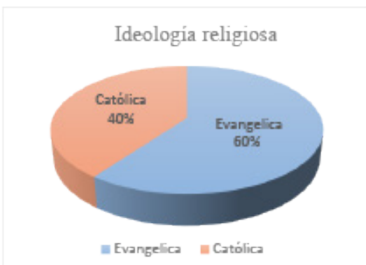
Fig. 1. Religión que profesan

Hay diferentes ideologías y creencias expuestas en las respuestas a esta interrogante, pero sin dejar por alto que no importa la religión, sino que seamos buenas personas y que sirvamos de ejemplo a nuestras generaciones. Cabe destacar, que en los jóvenes se fundamentan varios tipos de valores, pero estos en el transcurso de su vida vienen en decadencia principalmente en edades de 18 a 25 años porque es cuando estos están en un descubrimiento más a fondo del contexto, al igual aprenden a valorar y valorarse a sí mismos dependiendo principalmente de su tutor que los hará buenas personas para la sociedad o encaminarlos hacia el mal camino en el futuro.