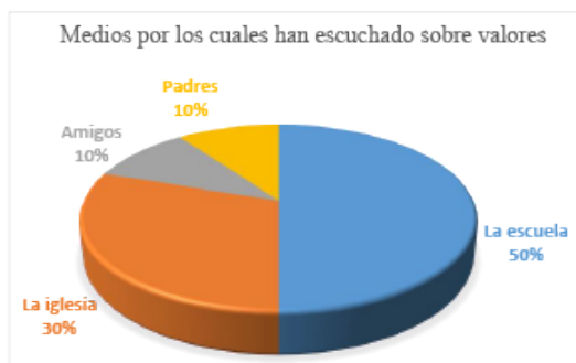
Fig. 2. Medios por los que se han adquirido conocimientos sobre valores

La comunicación es importante en una sociedad, debemos aprender a tolerarnos unos a otros para poder servir de ayuda a los demás cuando esto lo necesitan; aunque en ocasiones no todos pagan de la misma forma. Simplemente se trata de ser mejores personas cada día, aprendiendo de nuestros errores y, sobre todo, respetando a nuestros padres e incluso a nuestro tutor, ya sea un hermano, abuelo, tío, etc.