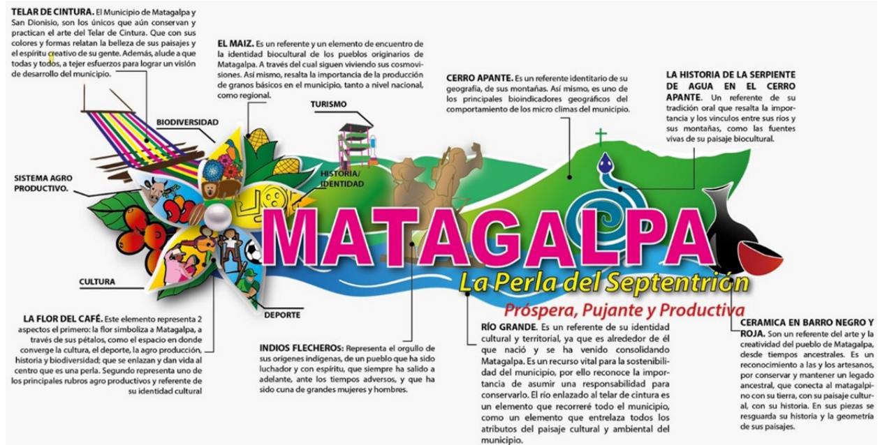
Figura N°1: Marca territorial del municipio de Matagalpa

Fuente: Tomado de (ALMAT y ODESAR, 2020).