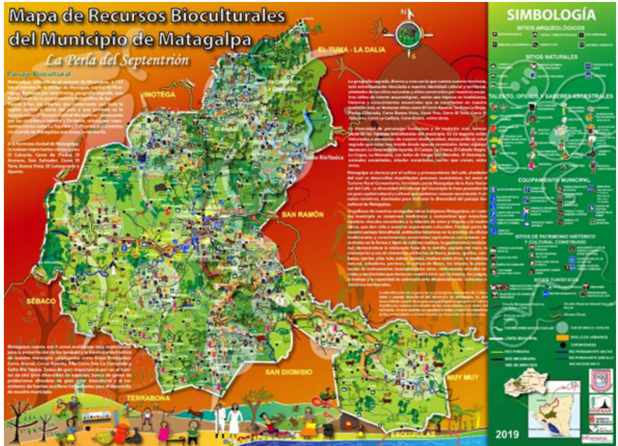
Figura N°2: Mapa de Recursos Bioculturales del municipio de Matagalpa