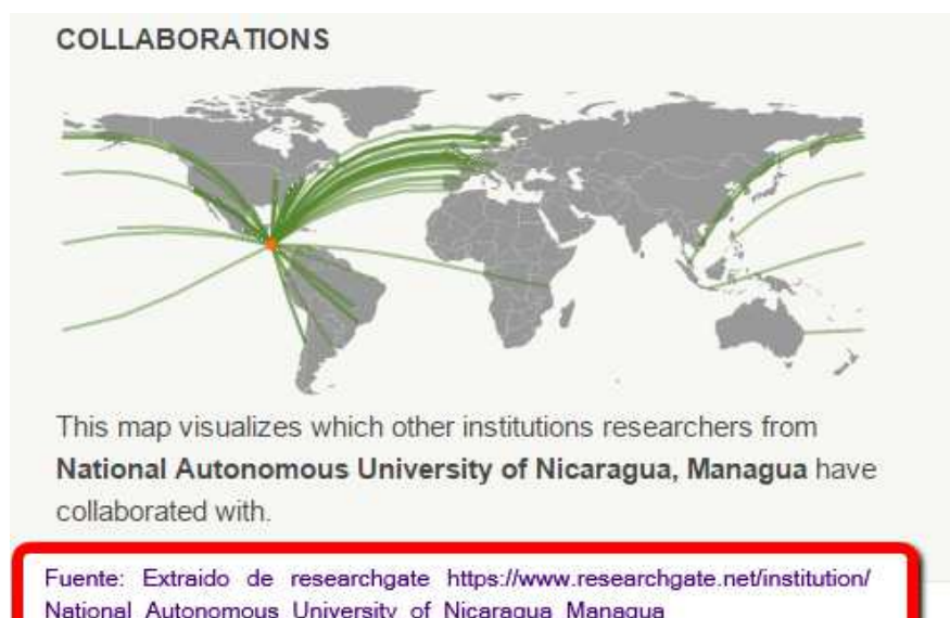
Figura # 1 UNAN Managua Colaboración en investigación

La innovación es un proceso interactivo, ubicuo e incierto (Lundvall, 2006). La universidad está estrechamente ligada en participar en la economía del aprendizaje y en contribuir en la construcción del sistema de innovación del país. La presión del modo 2 de producción de conocimiento en el siglo XXI (Gibbons et al., 1997), las demandas del contexto nacional y las demandas de la globalización y la internacionalización en el siglo XXI ejerce presión por cambios en el seno de la Universidad. Una gran parte del “arte” de la innovación está en la vinculación entre la universidad y la empresas las cuales no innovan en aislamiento, el acercamiento universidad empresas es una necesaria relación que debe cultivarse, remozarse y fomentar en la academia. En el lenguaje de economía evolutiva deben de haber políticas de “gardening” (Aubert et al., 2010).