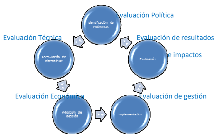
Gráfico No. 3: Evaluación integral de Políticas Públicas (Ahora)